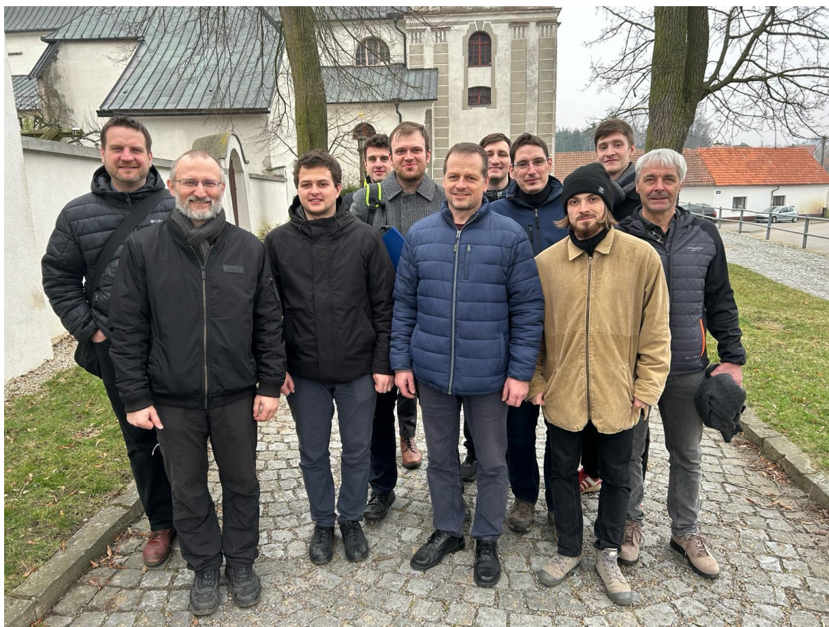
Muži z naší farnosti na setkání akolytů ve Velkém Meziříčí (9. 3. 2024)